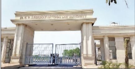
सोनीपत। सोनीपत के राई राजीव गांधी एजुकेशन सिटी स्थित डॉ. बीआर आंबेडकर राष्ट्रीय विधि विश्वविद्यालय।

डॉ. बीआर आंबेडकर राष्ट्रीय विधि विश्वविद्यालय में ऑडिटोरियम निर्माण के लिए तैयार किया गया था 60 करोड़ रुपये का बजट, हरियाणा पुलिस हाउसिंग कारपोरेशन को सौंपी गई है विवि में ऑडिटोरियम के निर्माण की जिम्मेदारी