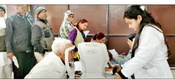
सोनीपत। शिविर में मरीजों की जांच करते चिकित्सक।

दी महाराजा अग्रसेन समिति द्वारा 42वां निःशुल्क नेत्र चिकित्सा एवं रक्तदान शिविर का आयोजन अग्रवाल धर्मशाला, गुड मंडी, सोनीपत में किया गया। शिविर में दिल्ली स्थित वेणु आई इंस्टीट्यूट एंड रिसर्च सेंटर से आए अनुभवी नेत्र विशेषज्ञों की टीम ने अपनी सेवाएं प्रदान कीं। शिविर के दौरान कुल 205 मरीजों की आंखों की गहन जांच की गई, जिनमें से 18 मरीजों में मोतियाबिंद की पुष्टि हुई।