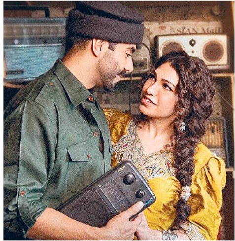
मुंबई। टी-सीरीज ने अपने आधिकारिक इंस्टाग्राम अकाउंट पर गाने की जानकारी देते हुए एक क्लिप शेयर