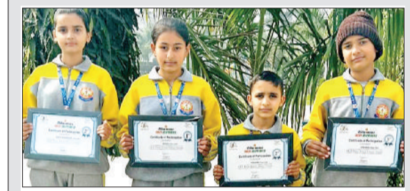
गोहाणा। प्रतियोगिता के विजेता विद्यार्थी प्रशस्ति पत्रों के साथ।