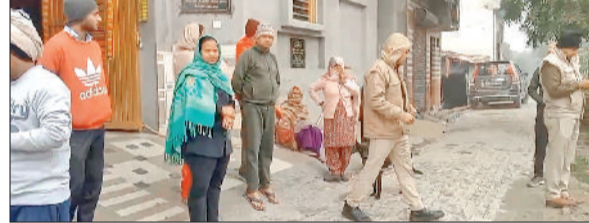
सोनीपत। वारदात स्थल पर मौजूद पुलिस कर्मी साथ में लोग।