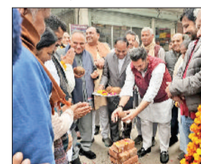
सोनीपत। विकास कार्यों का शुभारंभ करते हुए विधायक साथ में पूर्व मेयर एवं अन्य।

विधायक ने बताया कि वार्ड नंबर 15 की तीर्थ मार्केट की जर्जर हो चुकी