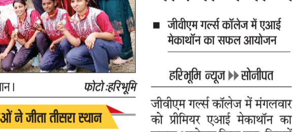
सोनीपत। विजेता प्रतिभागियों को सम्मानित करते प्रचार्या साथ में अतिथि।