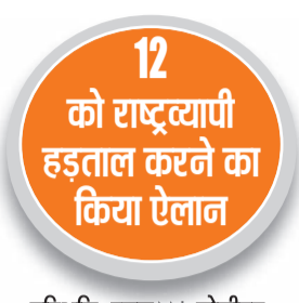
हरिभूमि न्यूज सोनीपत