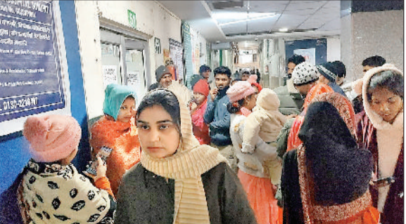
सोनीपत। नागरिक अस्पताल में अल्ट्रासाउंड कक्ष के बाहर लगी महिलाओं की भीड़।

दिल्ली रोड स्थित जिला नागरिक अस्पताल में अल्ट्रासाउंड व जांच करवाने आई महिलाओं को भ्रमित करने का मामला सामने आया है। अल्ट्रासाउंड व जांच करवाने के लिए अस्पताल में अल्ट्रासाउंड कक्ष के बाहर खड़ी कुछ महिलाओं ने वहां तैनात कर्मचारी पर भ्रमित करने का आरोप लगाया। महिलाओं