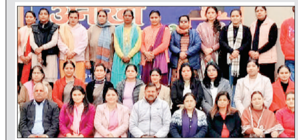
राई। ओम शांति स्कूल के शिक्षक के लिए कला-समेकित शिक्षण विषय पर कार्यशाला में भाग लेते हुए।