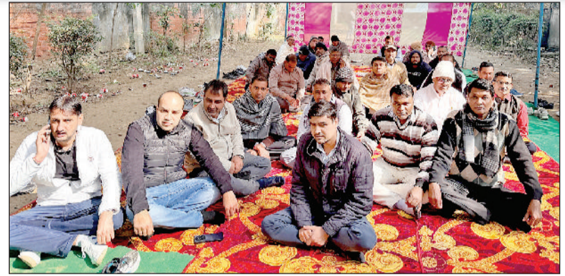
सोनीपत। सोनीपत के लघु सचिवालय परिसर में धरना स्थल पर हड़ताल कर रोष जताते दी रेवेन्यू पटवार एवं कानूनगो एसोसिएशन के जिला पदाधिकारी व सदस्य।

दी रेवेन्यू पटवार एवं कानूनगो एसोसिएशन, हरियाणा के आह्वान पर जिला पदाधिकारियों व सदस्यों ने क्षतिपूर्ति पोर्टल पर फसल खराबा में गलत रिपोर्ट के मामले में निर्लिबत किए गए पटवारियों के समर्थन में मंगलवार को भी अपनी हड़ताल जारी रखी। लघु सचिवालय परिसर के धरना स्थल पर पटवारियों व कानूनगो ने धरना देकर रोष जताया। हड़ताल के चलते जिला में रोजाना करीब 400 इंतकाल, 225 रजिस्ट्री व 600 रिहायशी प्रमाण पत्र संबंधी कार्य प्रभावित हो रहे हैं। पटवारियों व कानूनगो ने सरकार को चेताया कि अगर निर्लिबत किए गए 6 पटवारियों को जल्द बहाल नहीं किया तो वह 5 फरवरी से शुरू होने वाली फसल गिरदावरी भी नहीं करेंगे। जिले के 73 पटवारियों व 19 कानूनगो के हड़ताल पर जाने से पटवारखानों पर होने वाले कार्य नियमित रूप से प्रभावित हो रहे हैं। इससे खेतों में जमीन गिरदावरी का कार्य पूर्ण रूप से ठप हो रहा है। साथ ही आय, जाति, निवास प्रमाण पत्र व