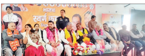
सोनीपत। बैठक के दौरान मौजूद मंत्री, विधायक साथ में भाजपा पदाधिकारीगण।

किया। कैबिनेट मंत्री पंवार ने कहा कि भाजपा निकाय चुनावों के लिए पूरी तरह तैयार है और संगठन को बूथ स्तर तक सक्रिय किया जाएगा। उन्होंने कहा कि पार्टी का लक्ष्य हर