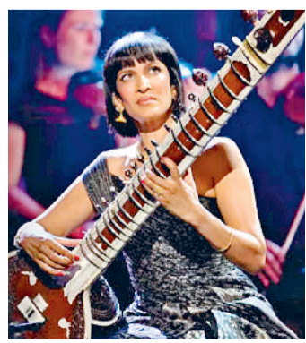
इंस्ट्रूमेंटल एल्बम में शामिल था। इसके साथ ही पर्युजन बैंड शक्ति (शंकर महादेवन, जाय मैकलॉघलिन, गणेश राजगोपालन और वी. सेतलामणेश के बैंड) को दो नामांकन मिले। उनका लाइव एल्बम माईड एक्सप्लोरेशन बेस्ट ग्लोबल म्यूजिक एल्बम में और ट्रैक शेरीनी