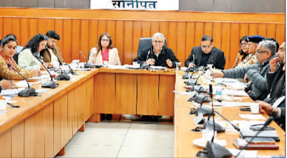
सोनीपत। बैठक के दौरान मौजूद अधिकारीगण।